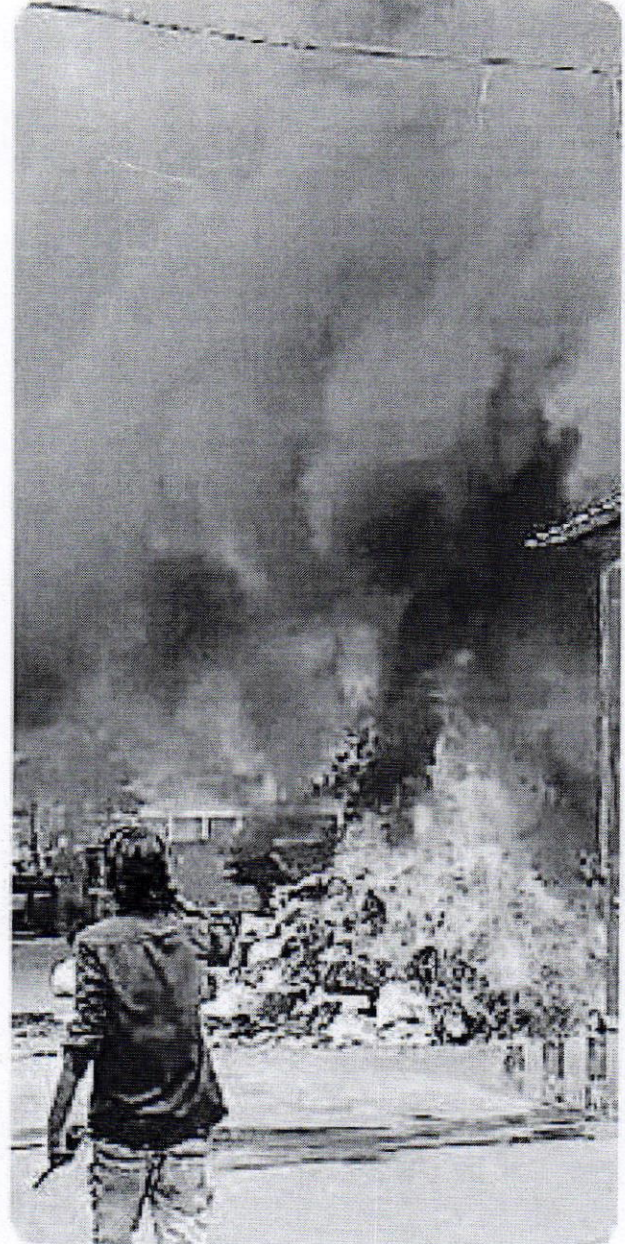
आरिफ नगर स्थित नगर निगम के कचरा प्लांट में लगी आग।

बता दें कि कचरा प्लांट में जिस जगह आग लगी, वहां पर थर्माकोल और कपड़ों का करीब 10 टन कचरा रखा हुआ था, जो पूरी तरह से जल गया। इसके अलावा कैमरे, ऑनलाइन वेट रीडर, केबिन, केबल